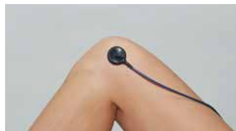
平型プローブを使用した低出力超音波療法