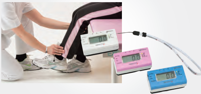
ハンドヘルドダイナモメーター モービー

標準プッシュセンサーのほかに、プルセンサー、 ピンチセンサーなどオプションが充実。