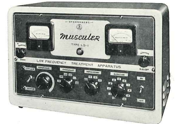
主要寸法 42×29×22cm 重量 11kg 構造 使用真空管 8本 発振音可聴式