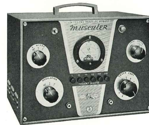
主要寸法 24×35×20cm 重量 8kg