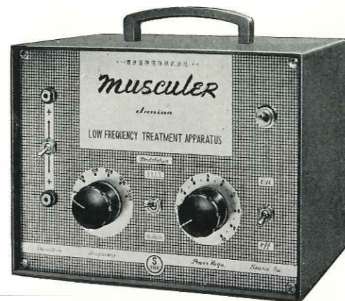
主要寸法及重量 22×27×16cm 5.5kg